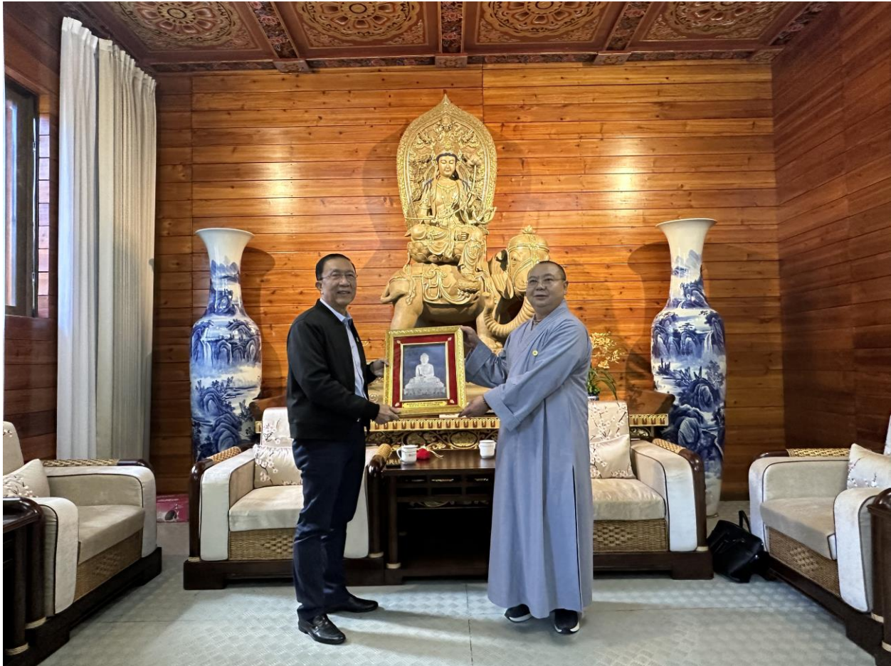
ဟွာကျန်ဘုရားကြီးရှိ ဘုန်းတော်ကြီးထံ မာရဝိဇယဗုဒ္ဓရုပ်ပွားတော်မြတ်ပုံတော်အား အမှတ်တရ ပေးအပ်စဉ်